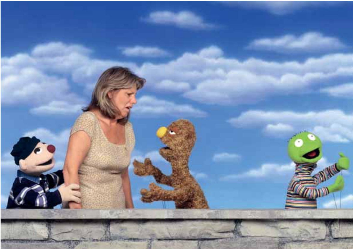
The Persuaders, 2003