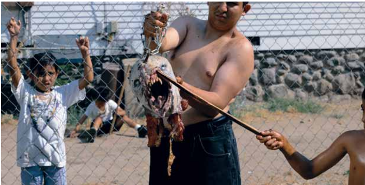
Highland Park, 1999

was hij vastbesloten om pornografie tot kunst te verheffen. Zijn geësceneerde, meestal grootformaatfotografie, die in een vroeger stadium verwantschap vertoont met het werk van Jeff Wall en Gregory Crewdson, evolueert van narratief-geconstrueerd tot abstract-experimenteel. Zelf zegt hij daarover in een in Cannes gehouden interview: 'Ik wilde de gestructureerdheid van het verhalende element of het scenario van de foto doorbreken door het onderwerp centraal te stellen. Daarom overwoog ik de rol van film in mijn werk. Hoe minder filmisch mijn foto's werden, hoe meer ik geïnteresseerd raakte in film, als onderzoek van een bepaald thema gedurende een aantal minuten. American Minor zou je een fotografische film kunnen noemen. Experimenterend met subtiele bewegingen en andere eigenschappen die film je biedt door het geluid en de tijdsduur.'