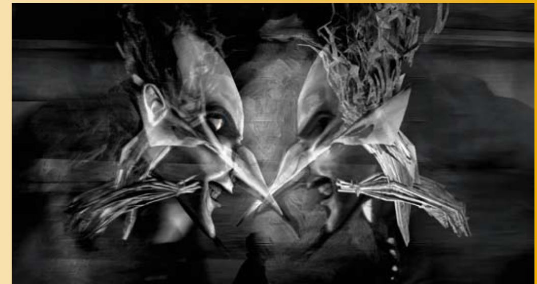
Boven en onder: stills uit Jona/Tomberry, Studio Rosto A.D