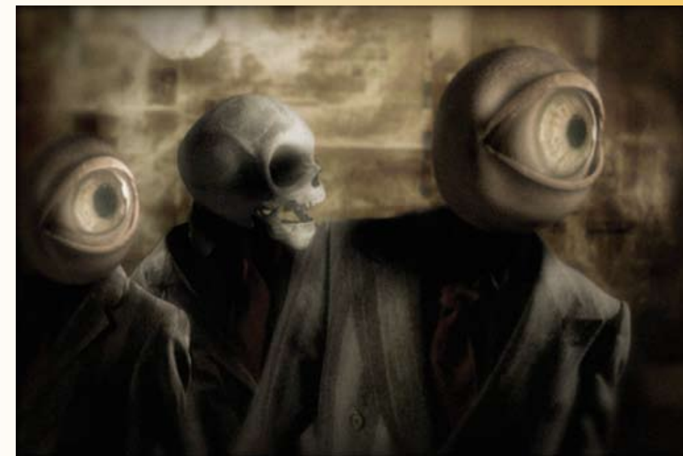
Uit: Phantom van The Residents, Studio Rosto A.D

Voor het komende Clermont-Ferrand-animatiefilmfestival (26 januari – 3 februari) tekende Rosto voor de artdirection, die gebruikt werd voor onder meer folders, tassen, billboards en de catalogus. Daarnaast zit hij in de jury. Meer informatie over dit festival: www.clermont-filmfest.com .