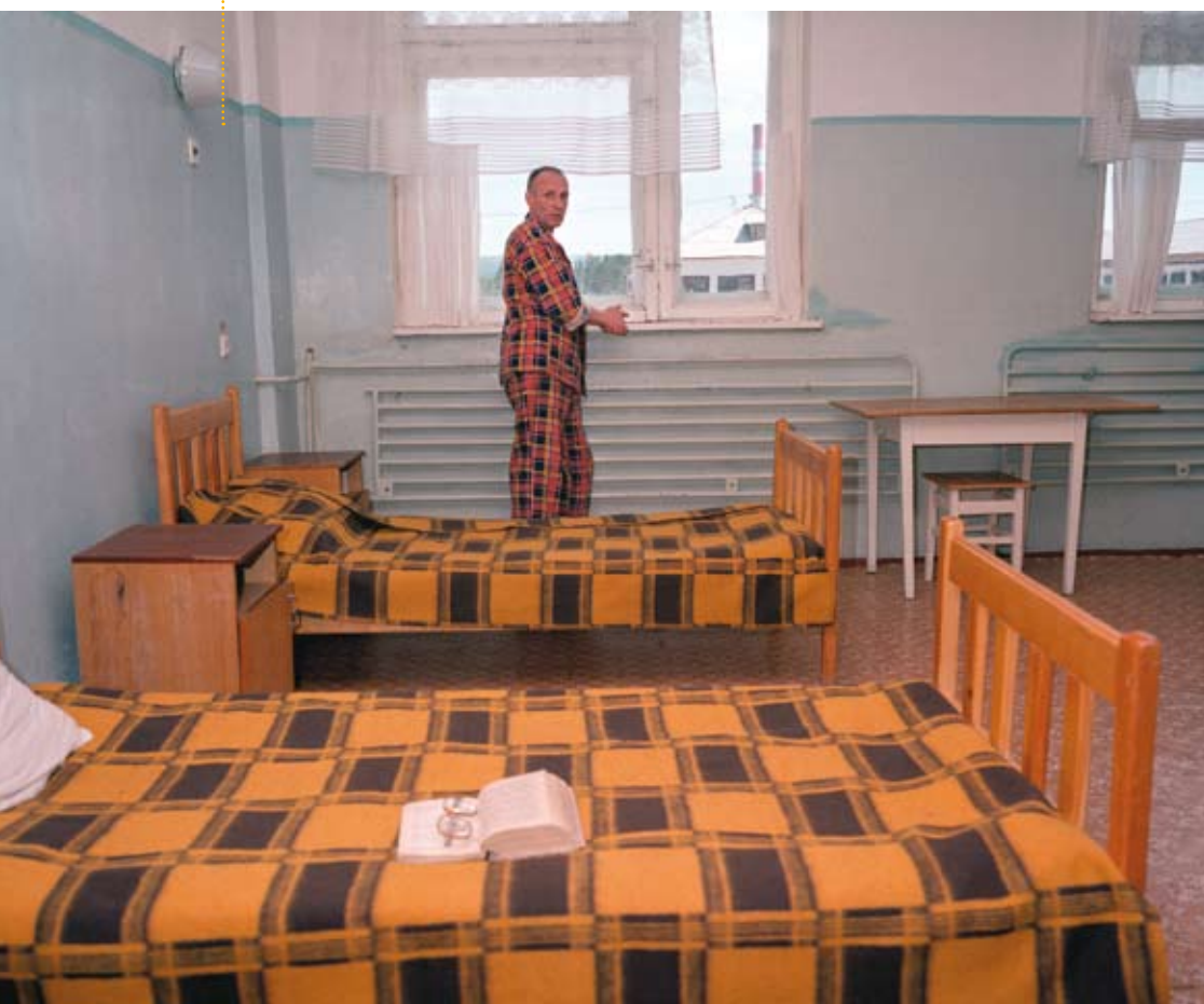
Zona - Siberian Prison Camps 2003

Een voormalig patriciërs huis in de negentiende eeuwse Gentse arbeiderswijk Dampoort vormt het onderkomen van Carl De Keyzer. Als enige woning draagt het ornamenten aan de gevel. Ooit was dit het huis van de directeur van een pal erachtergelegen staalfabriek; de omringende, veel bescheidener huizen werden bewoond door staalarbeiders.