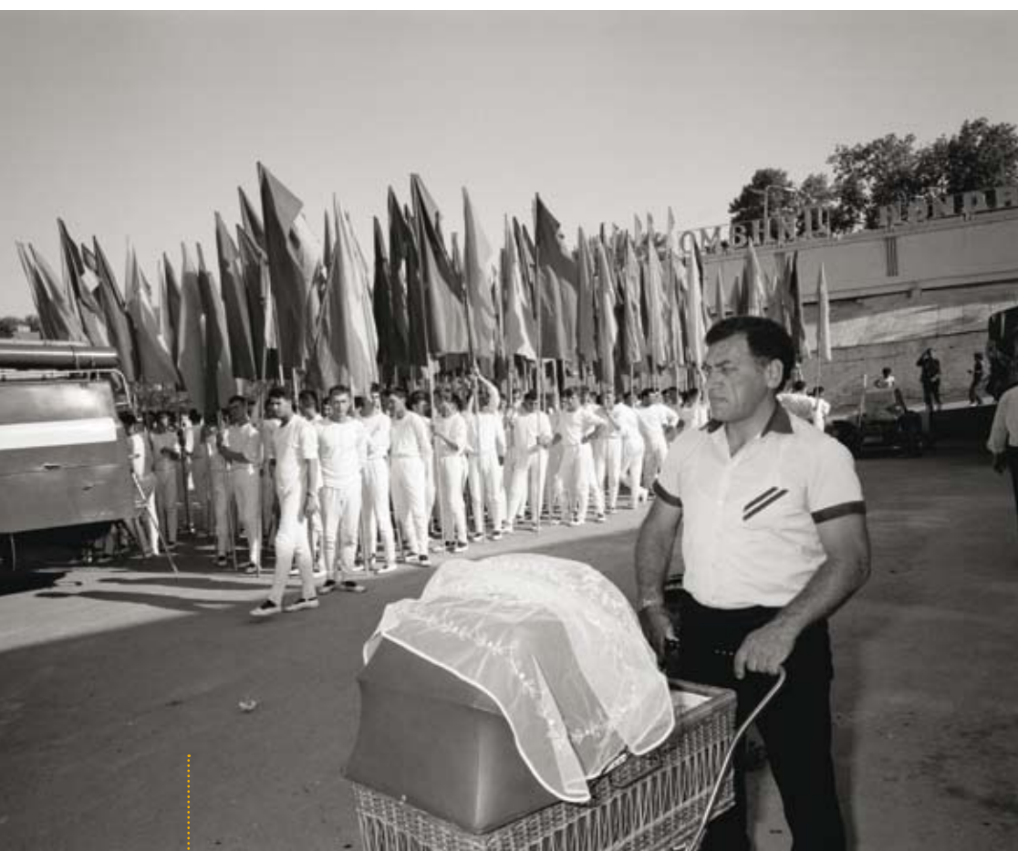
Homo Sovieticus, 1989

Kleine vriendencollectieven, zoals Noor (opgericht door onder anderen Kadir van Lohuizen) en VII (begonnen door oorlogsfotografen waaronder James Nachtwey) kunnen misschien uitkomst bieden, maar hij gelooft niet dat ze klein blijven. 'VII is begonnen met zeven, maar telt