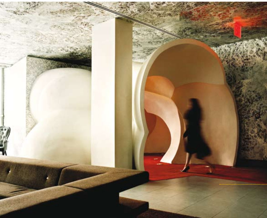
Thor, Hotel on Rivington, New York foto: Inga Powilleit styling: Tatjana Quax

De 3D-blik van Wanders. Zoals een fotograaf zijn onderwerp aftast door de zoeker, zo