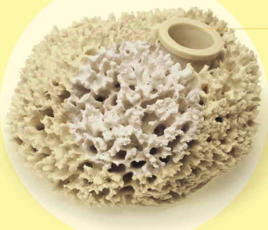
Moool, Sponge Vase

..... wereld aan het doen was en wat ik daarin moest doen. Als je eenmaal je missie hebt: dit is wat ik moet doen, ontstaat een andere inhoud. Toen ik 33 jaar was, kwam ik tot dat inzicht.' Lachend: 'Symbolisch, ja, maar ik ben ook rooms-katholiek. 33 is een religieuze belangrijke leeftijd. Jezus kwam naar buiten met zijn getuigenissen op zijn 33ste en werd daar uiteindelijk om vermoord.' Verdomd. In 1996, op zijn 33ste, brak Wanders internationaal door, met zijn via Droog Design uitgebrachte Knotted Chair . Dit "huwelijk" tussen high-tech en innovatief industrieel design en ambachtelijk macramé (materialen: aramide, carbon en epoxyhars) werd in 1997 door het publiek bekroond op