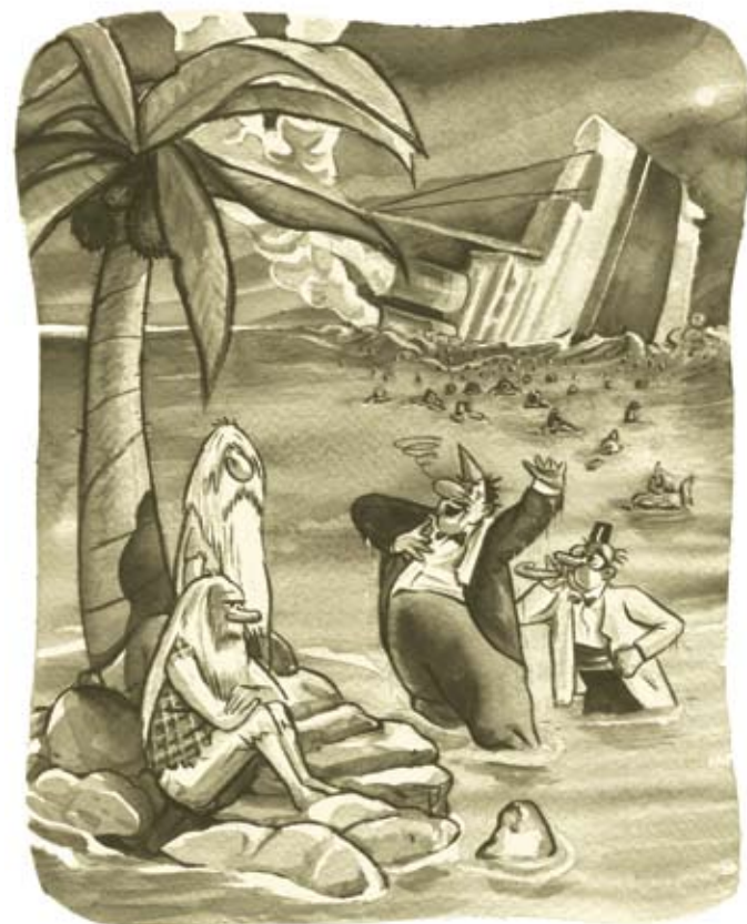
Uit: Chozizo #3 (2003)