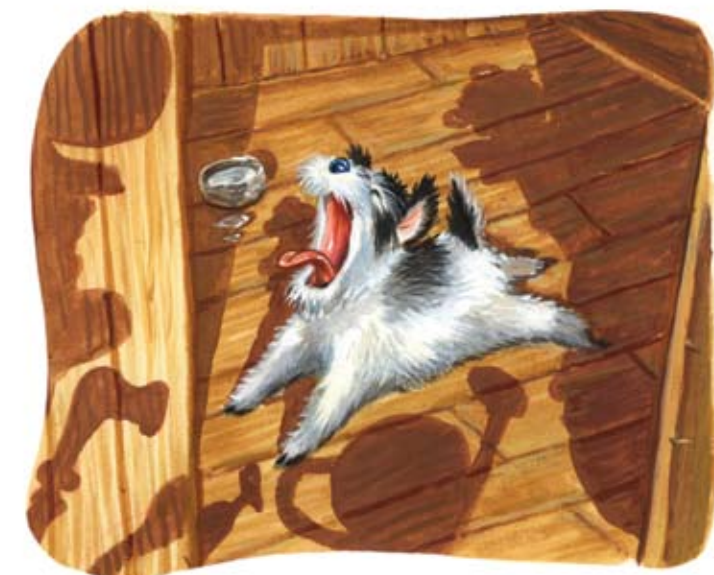
Hondje Toos figureert in het Gouden Boekje De Wolkenfabriek (2006)