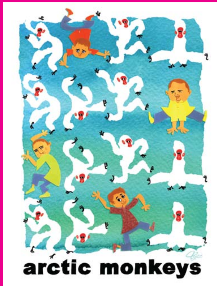
Illustratie voor OOR (2006)

niet: "Zo mooi, bijna een bankstel." Een schemerlamp geeft licht, een bank niet. Ik wil een lans breken voor strips. Het is geen ondergeschoven kindje, het is het mooiste medium om mee te werken. Ik ben er trots op striptekenaar te zijn. Altijd al geweest ook.'