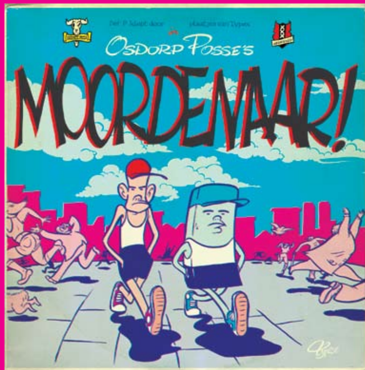
Typex' versie voor Strips In Stereo (2006)