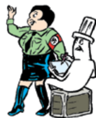
Uit de strip "Action" (Filmkrant, 2005)

Hectisch en eclecticisch: twee woorden die in een notendop leven en werk van striptekenaar/illustrator Typex kenschetsen. De afgelopen jaren is zijn relatief rustige bestaan in een stroomversnelling gekomen sinds het publiek zijn eigenzinnige tekeningen ontdekte. Hij blijft er nuchter onder en werkt onverstoort voort op zijn zolderkamer in Amsterdam West. 'Ik kan de hele dag plaatjes draaien en poppetjes tekenen.'