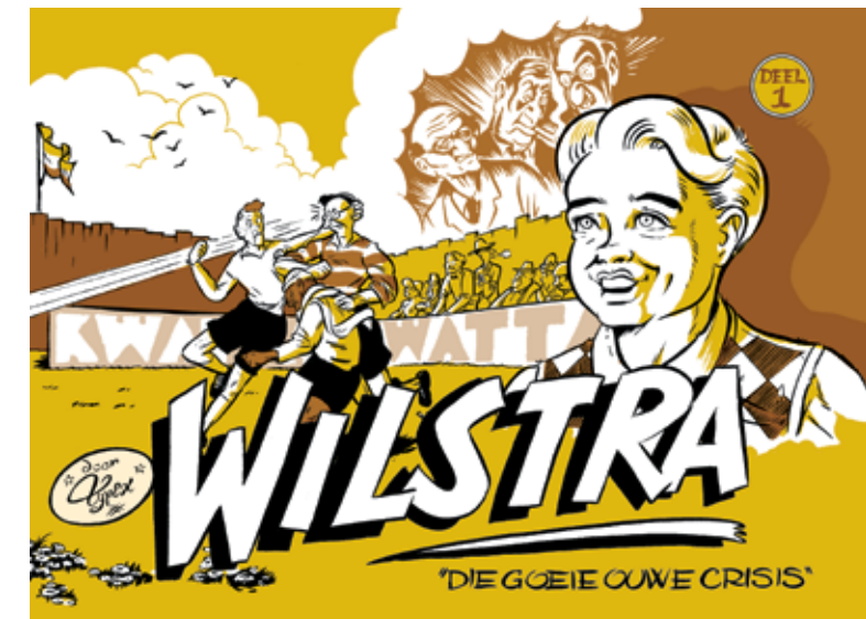
Omslag Wilstra #1 (2004)

Robert Crumb, Will Eisner en Raw's geestelijk vader Art Spiegelman, ieder de beschikking over drie stripblokjes. Daarnaast tekent hij regelmatig voor een Australisch blad en werkt hij aan zijn website (www.typex.nl), die nog dit jaar gelanceerd wordt. Meer buitenlandse klussen sluit hij niet uit. In wat voor stijl of met wat voor materiaal dan ook. 'Ik heb een mateloos vertrouwen in mijzelf. Als ze me morgen vragen om een tegelmozaïek te maken, dan doe ik dat gewoon. Zoek ik wel in een boek op hoe dat moet.'