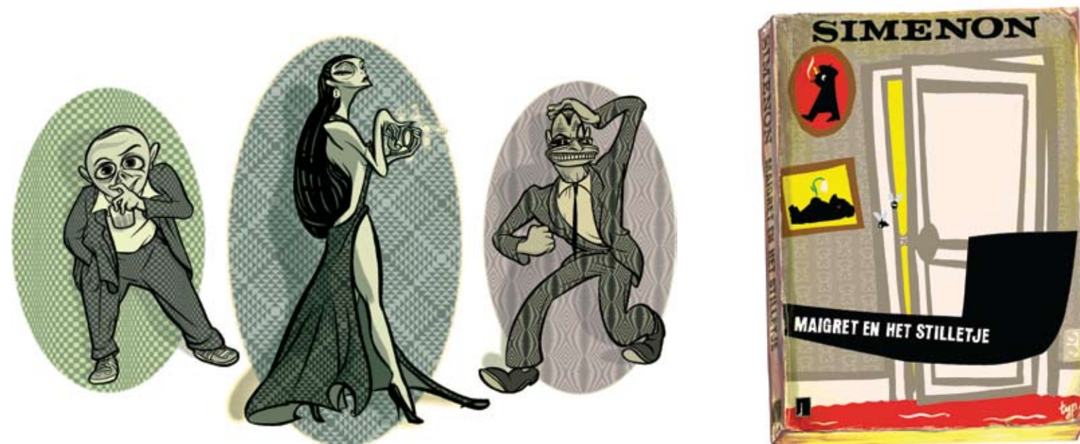
Illustraties voor Playboy (2000)