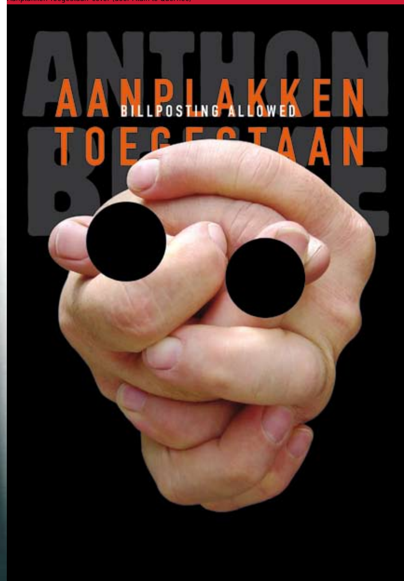
Aanplakken Toegestaan-cover (door Alain le Querrec)