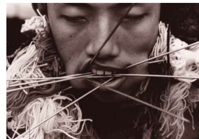
Vegetarian Festival, Thailand (Exaltation, 1999); Courtesy Galerie Gabriel Rolt