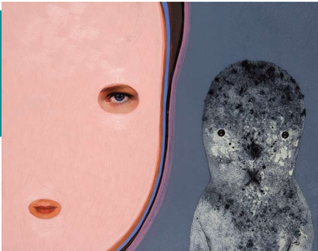
Encounter, 2006, 40 x 40 cm, olie, epoxy, div. wol op linnen, foto: Theo Bos

Wat mensen als "echt" ervaren - de ogen op het doek - is een afgeleide van een afgeleide van een afgeleide. En het wordt bovendien door onze zintuigen waargenomen. Het was een bevrijding, dat ik collage überhaupt als middel mocht gebruiken. Waarom moet je schilderideeën altijd schilderen?