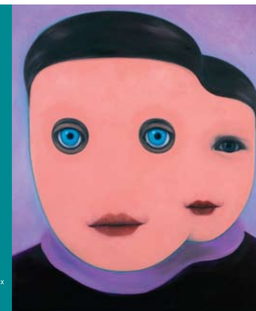
Brothers in Arms, 2001-2002. Olieverf op linnen, 180 x 150 cm., collectie kunstenaar