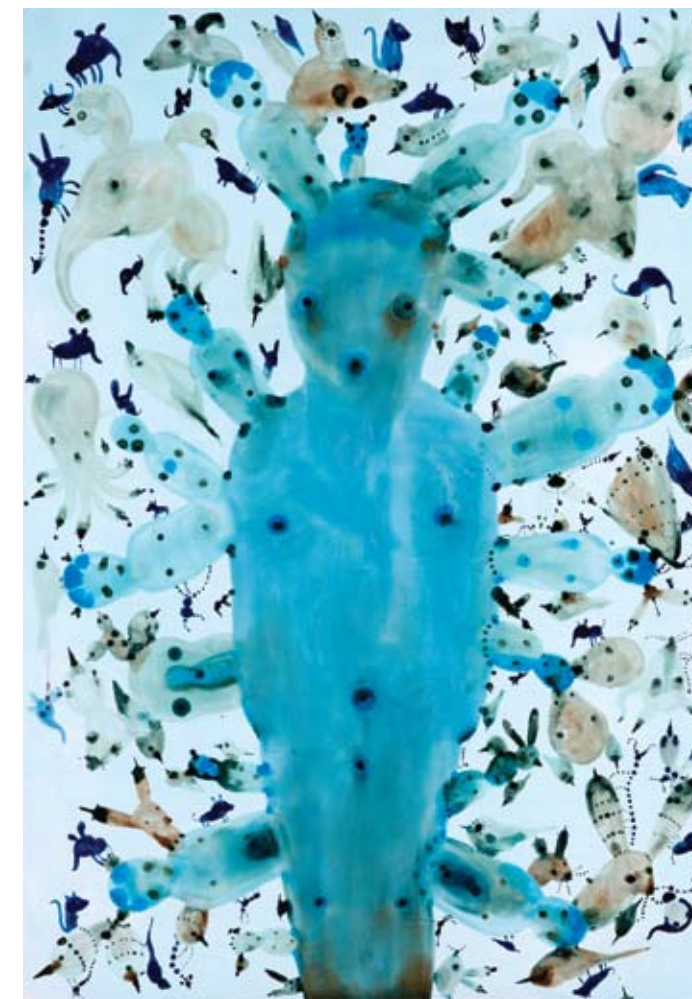
Mensenmensenmens, 2005. Acryl, olieverf en epoxy op paneel, 100 x 70 cm., collectie kunstenaar

'Misschien ben je wel tijdelijk gek als je schildert, maar er is altijd een soort time-out. Ik kan spijkerhard rationele besluiten nemen, terwijl ik het toch laat gebeuren tijdens het werken. Het heeft een tijd geduurd totdat ik daar aan toe was. De gekte, het rauwe versus het rationele, het streng toepassen van een keuze. Ik werk nu relatief snel, al wordt de voorbereiding steeds langer. Maar als ik ga, dan ga ik. Het is de dood of de gladiolen.'