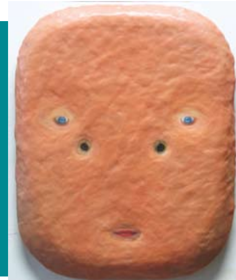
Dubbelportret, 2000. Bijenwas, collage op paneel, 40 x 32 cm., collectie kunstenaar, foto: Theo Bos

In dergelijke literatuur komen ook onderwerpen als realisme in de kunst en perspectiefwerking aan de orde. 'We hebben last van de erfenis van de Renaissance', vindt Roerade. 'Dat is de beperking van ons oog. We construeren de werkelijkheid en worden continu belazerd. Zo zien we geen lucht: ervaren leegte. Maar lucht is natuurlijk substantie. Het renaissanceperspectief wordt altijd gedefinieerd als realisme in de beeldende kunst. Onzin, we creëren een illusie. Ik vind dat een vrij formele vorm van ordening van ruimte.'