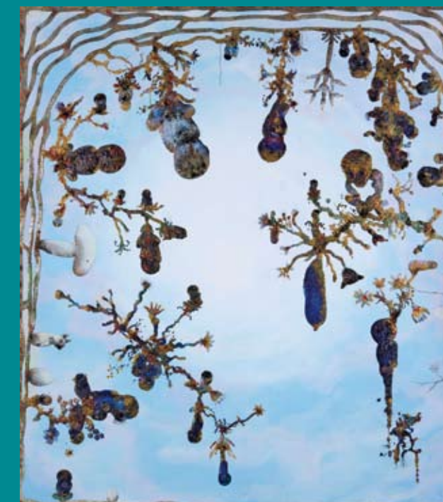
Blue monkey world, 2006, 180 x 160 cm, acryl, olie, giethars, div.wol div. glitters op linnen